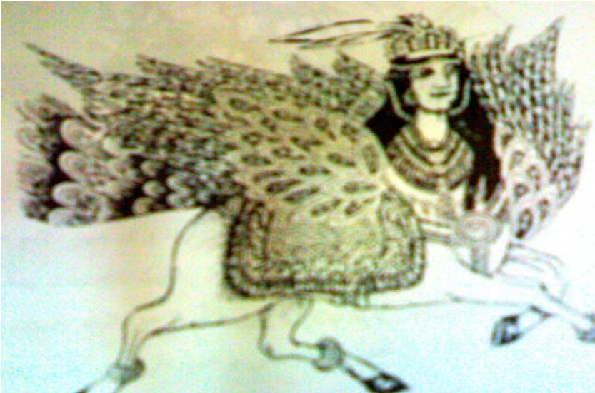
تصویر شماره ۳